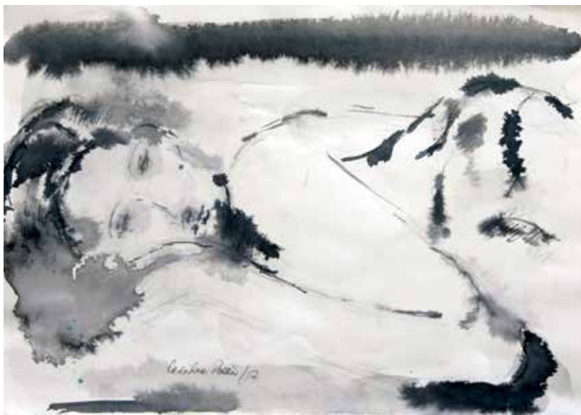
Sin título, 2017